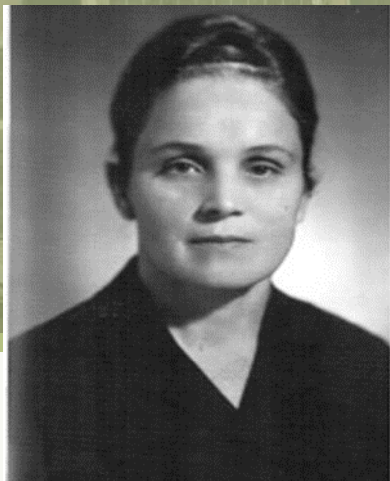
МИЛЕЙ ЛЮДМИЛА ВЛАДИМИРОВНА (1926– 1987)

Самый знаменитый лидский учитель математики. «Заслуженный учитель школы БССР» (1966), кавалер ордена Трудового Красного Знамени (1978).